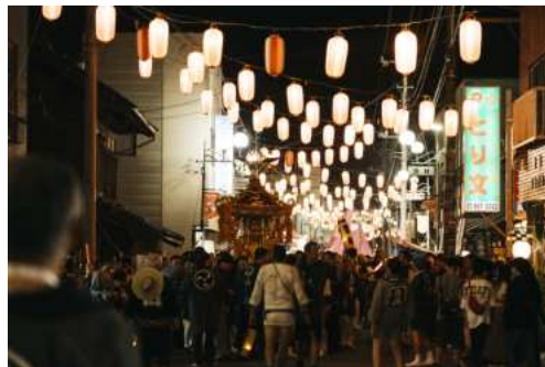
写真：北条商店街の祭りの様子